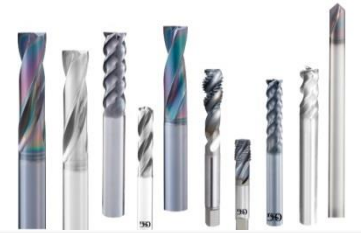
เครื่องมือตัด