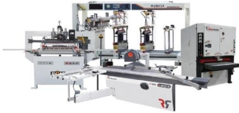
เครื่องจักรงานไม้