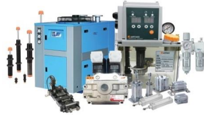
อุปกรณ์นิวเมติก