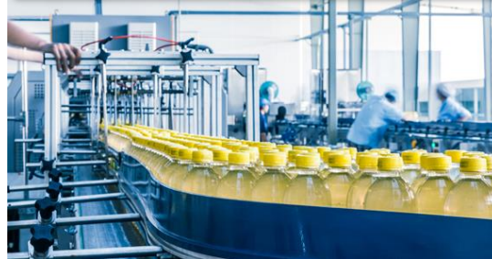
อาหารและเครื่องดื่ม