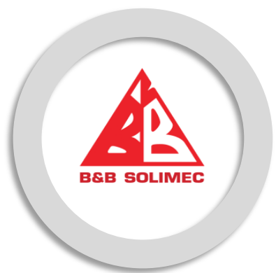
บริษัท บีแอนด์บี โซลิเมค จำกัด B&B Solimec Co.,Ltd.