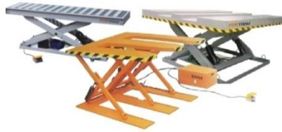
เครื่องยกอัตโนมัติ