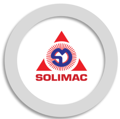
บริษัท โซลิเมค จำกัด Solimac Co.,Ltd.