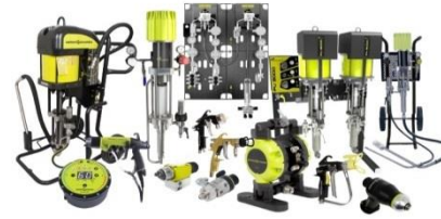
อุปกรณ์พ่นสี