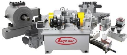
อุปกรณ์ไฮดรอลิก