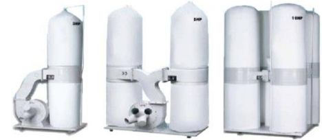
ระบบดูดฝุ่นอุตสาหกรรม