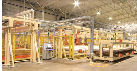
เฟอร์นิเจอร์