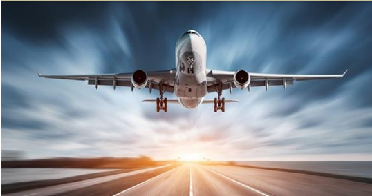
การบินและอวกาศ