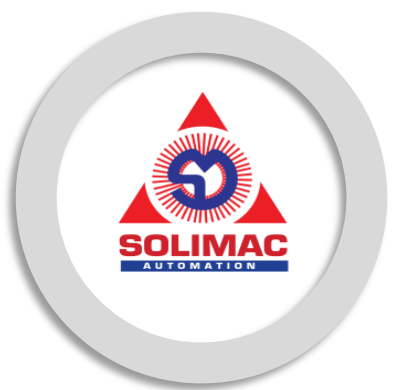
บริษัท โซลิเมค ออโตเมชั่น จำกัด Solimac Automation Co.,Ltd.